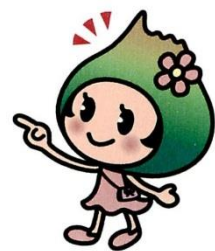
七飯町観光 PR キャラクター ポントちゃん

●応募方法● デジタルカメラで撮影した作品を六ツ切(203x254)または A4(210x297)にプリントし、 必要事項を記入した応募票を添えて 、七飯大沼国際観光コンベンション協会宛に 郵送 もしくは、 直接お持ちください 。(家庭用インクジェットプリンタ可)。プリント裏面には、 撮影者名、作品名、撮影年月日 を必ず記入してください。