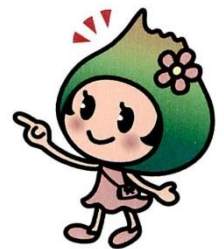
七飯町観光PRキャラクター ポントちゃん

★応募方法★ デジタル撮影された作品を六つ切(203x254)または A4(210x297)にプリントし、必要事項を記入した応募票を添えて、七飯大沼国際観光コンベンション協会宛に郵送もしくは、直接お持ちください。(家庭用インクジェットプリンタ可)。 プリント裏面には、撮影者名、作品名、撮影年月日を必ず記入してください。